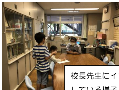
校長先生にインタビューしている様子

国語の学習では、新しい学校生活をテーマに、新聞を作りました。先生方にインタビューをしたり、アンケートを作って集計したりし、情報を集めました。記事を書く際には、事実を正しく伝えることや読み手にとって分かりやすいように書くことに気を付けました。